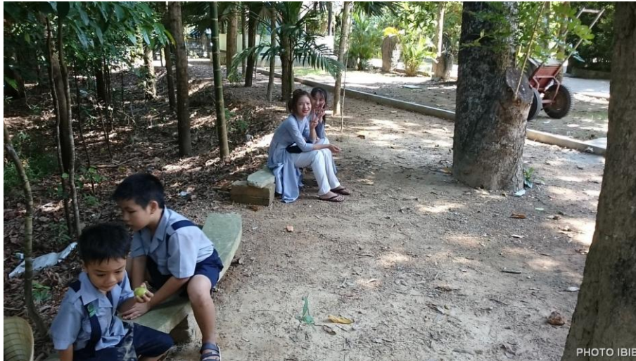
Nhỏ to tâm sự

Quý Thầy và các dì Tu Viện Long Quang đã chuẩn bị cho các em những hộp cơm nóng, đầy, ngon miệng... một bữa cơm trưa trong màu xanh của Trại, của cây cối vườn chùa, thật ấm cúng, không sao nói được thành lời.