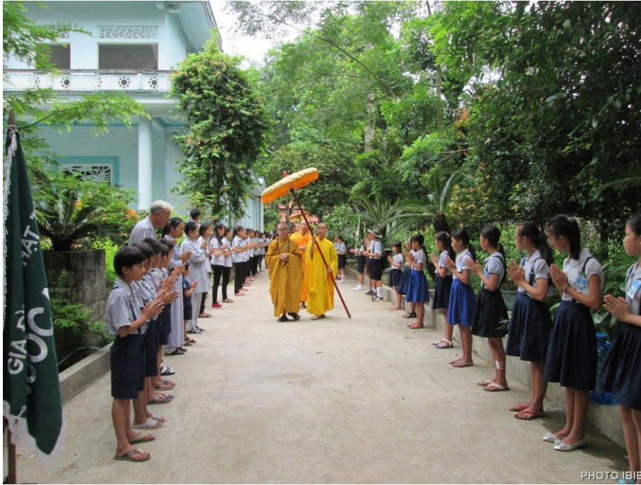
Cung thỉnh Hoà thượng Chứng minh đến đất Trại