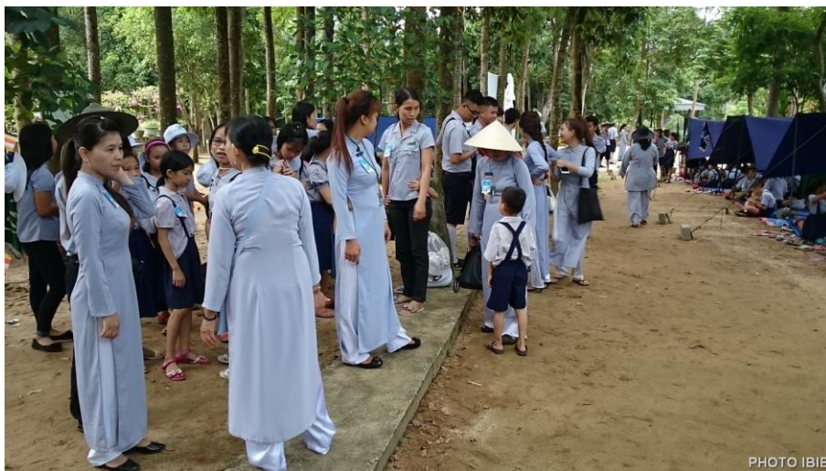
Gặp nhau tay bắt mặt mừng