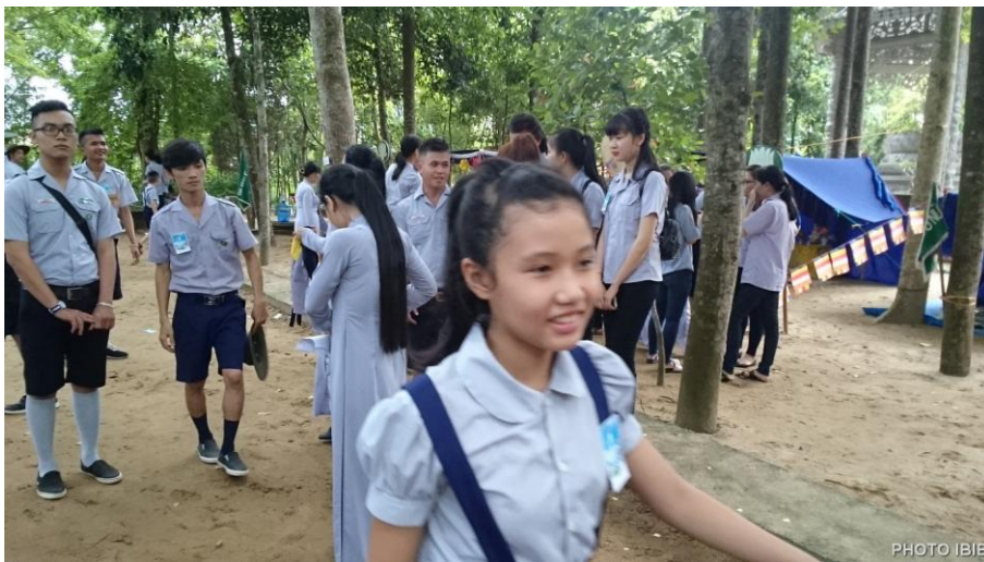
Gặp nhau trao đổi