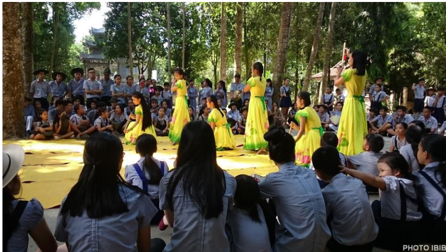
Một điệu múa