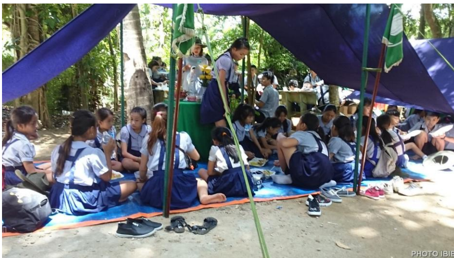
Gặp nhau tay bắt mặt mừng