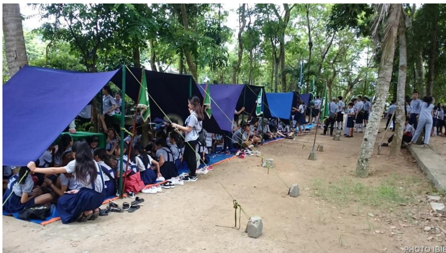
Lều trại đã dựng lên