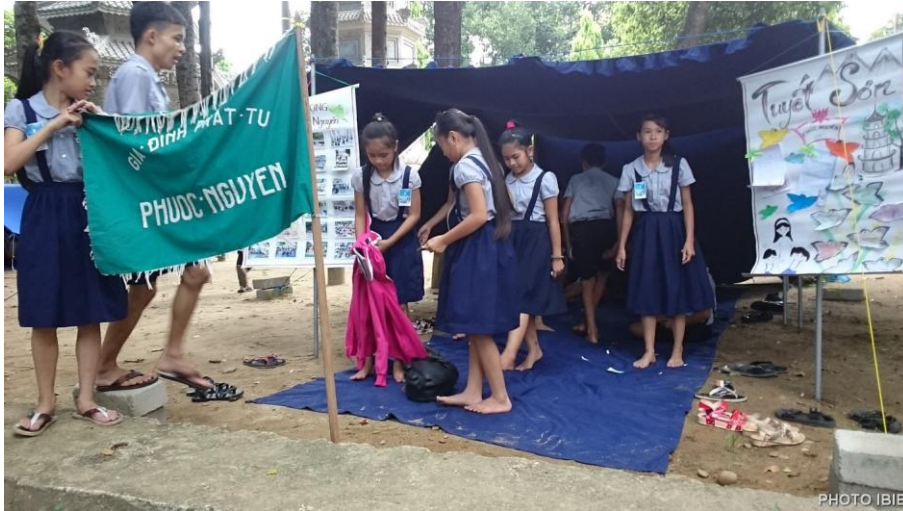
Oanh vũ dựng lều