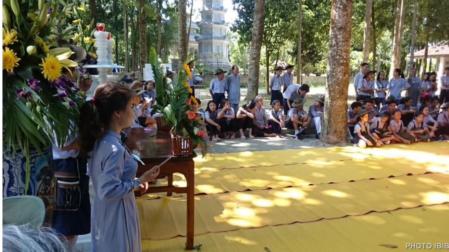
Sân khấu văn nghệ Trại

Bao nhiêu thời gian tập luyện chỉ chờ giờ phút này. Cũng rất sâu lắng, chuyên nghiệp, thế nhưng đau đớn là hoàn cảnh Giáo Hội Phật Giáo Việt Nam Thống Nhất bị áp bức, không cho phép các em có thời gian, không gian làm bừng sáng tài năng của mình để phục vụ Chánh Pháp, phục vụ Nhân Sinh, phục vụ Tổ Chức Áo Lam mà các em đã trao gởi tuổi thơ của mình.