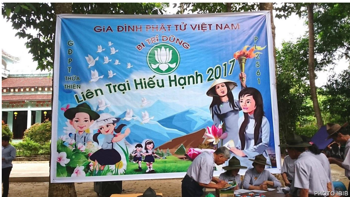
Tám biển Liên Trại Hiếu Hạnh 2017

Các Anh Chị Trong Ban Hướng Dẫn và trong Ban Quản Trại đã đến được Tu Viện Long Quang, liên tục gọi cho các đơn vị trong nỗi lo lắng tột cùng, nơi thì báo trình đang bị đuổi xuống xe, nơi đang bị chặn dọc đường, nơi xé lẻ ra từng nhóm vài ba em để lên xe khách. Hình dung cảnh thương tâm chưa từng có, quý Thầy và các Anh Chị Huynh trưởng không khỏi rung rung nước mắt.