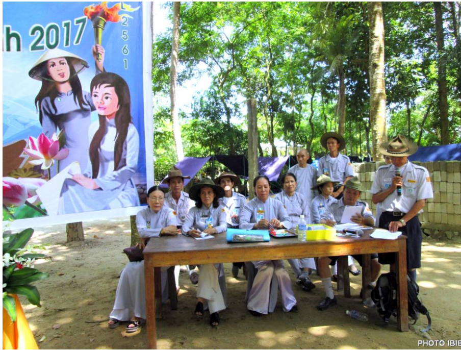
Ban Quản trị Trại