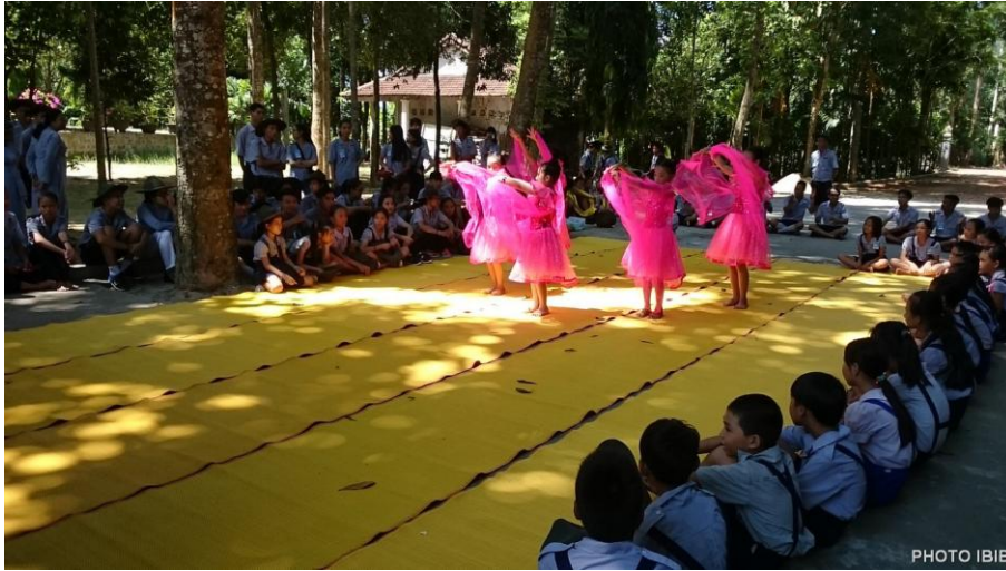
Các em Oanh vũ khoe tài

Kính bạch Chư Tôn Đức Kính thưa Quý Liệt Vị