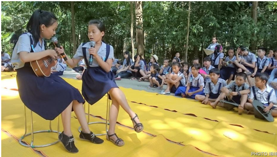
Mâm non Văn nghệ

Hôm nay trong niềm vui thành công của Trại, trong nỗi đau các em phải gánh chịu để được đoàn tụ trong ngày Truyền Thống và nỗi đau ấy có thể tiếp diễn không ngừng.