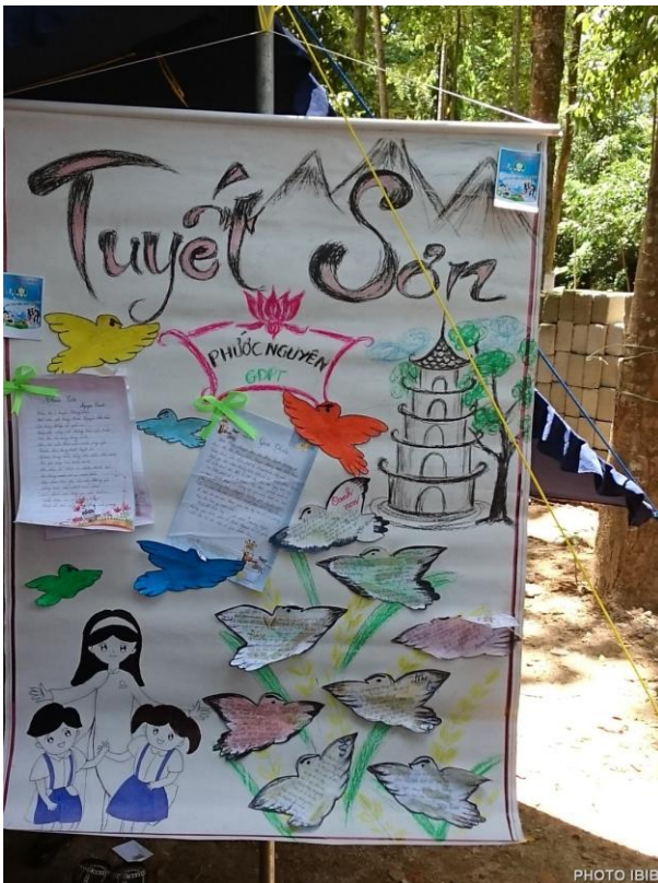
Tấm biển của Trại sinh

Thành kính cảm ơn các Anh Chị Huynh Trưởng địa phương đã dạy cho các em tinh thần Vô Úy, tinh thần mà Đức Đệ Ngũ Tăng Thống của chúng ta luôn nhắc nhở Phật Tử đối mặt với hiện tại trong công cuộc giải trừ Quốc nạn và Pháp Nạn.