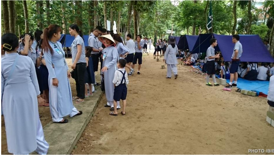
Gặp nhau tay bắt mặt mừng