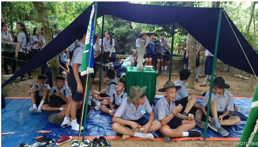
Gặp nhau tay bắt mặt mừng