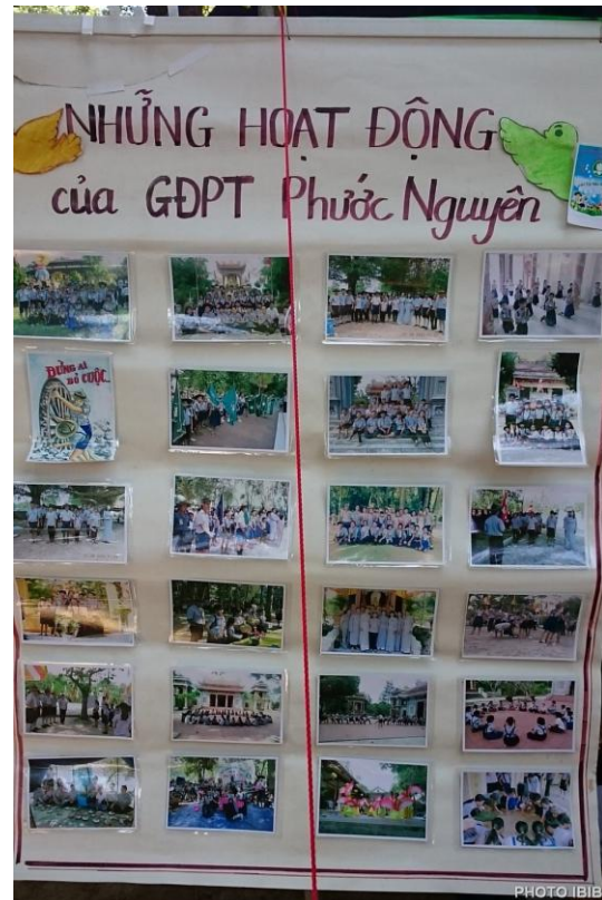
Bản tin hoạt động bằng hình