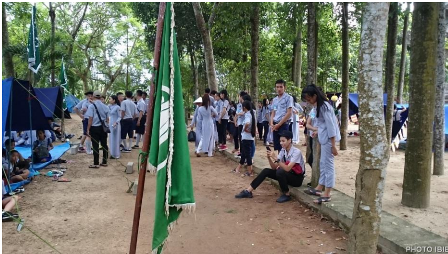
Gặp nhau tay bắt mặt mừng

Sau Lễ Khai Mạc, các em đi vào sinh hoạt sôi động của tuổi trẻ, quên cả lo âu, nhọc nhằn.