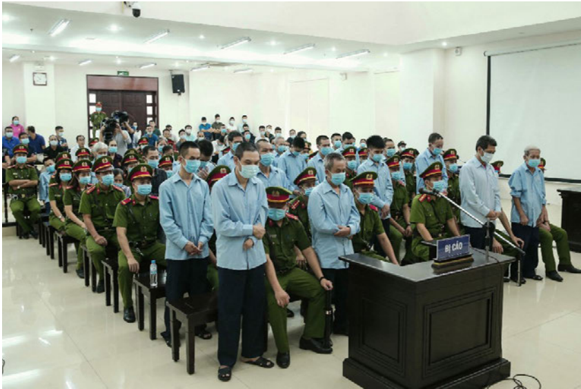
Bức ảnh này do Thông tấn xã Việt Nam chụp và phát hành vào ngày 14 tháng 9 năm 2020 cho thấy những người dân xã Đồng Tâm bị bắt trong một vụ tranh chấp đất đai đang tham dự phiên tòa xét xử ở Hà Nội.