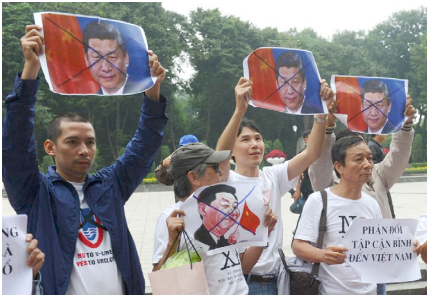
Những người biểu tình hô to các khẩu hiệu chống Trung Quốc và giơ cao các hình vẽ Chủ tịch Trung Quốc Tập Cận Bình trước Đại sứ quán Trung Quốc tại Hà Nội vào ngày 5 tháng 11 năm 2015, vài giờ trước khi nhà lãnh đạo Trung Quốc đến Việt Nam trong chuyến công du.