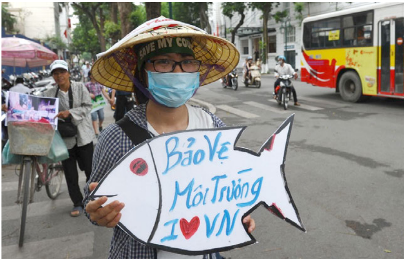
Người biểu tình phân đội tập đoàn FHS của Đài Loan trong một cuộc biểu tình ở Hà Nội vào ngày 1 tháng 5 năm 2016.

Nhìn chung, rất nhiều nhà hoạt động xã hội dân sự đã bị đánh đập, sách nhiễu và giam giữ tùy tiện vì ghi chép hoặc phản đối một cách hòa bình thảm họa môi trường này, mà những hậu quả đau đớn vẫn còn tiếp diễn cho đến ngày nay.