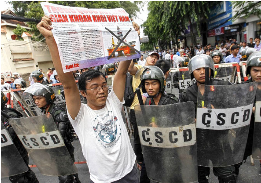
Một người biểu tình phản đối chống Trung Quốc đứng trước cảnh sát chặn một con đường dẫn đến lãnh sự quán Trung Quốc trong một cuộc biểu tình ở trung tâm thành phố Hồ Chí Minh vào ngày 11 tháng 5 năm 2014.

chống Nhà nước Cộng hòa Xã hội Chủ nghĩa Việt Nam” (Điều 88 Bộ luật Hình sự năm 1999). Vào ngày 24 tháng 9 năm 2012, ông bị kết án 12 năm tù trong một phiên tòa chỉ kéo dài vài giờ 115 .