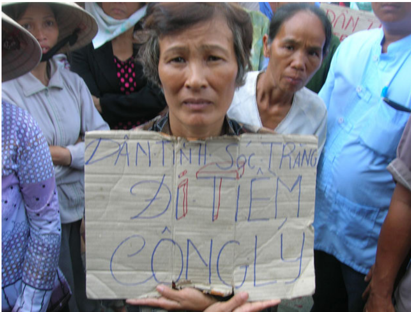
Một phụ nữ biểu tình bên ngoài Văn phòng Quốc hội số 2 tại Thành phố Hồ Chí Minh vào tháng 7 năm 2007. Biểu ngữ của bà ấy viết : “Dân tỉnh Sóc Trăng đi tìm công lý.”

cuộc đất của nông dân ” đã đụng độ với công an 93 . Truyền thông, báo chí bị cấm đoán, các cuộc biểu tình bị giải tán và nhiều người đã bị bắt. Ít nhất chín người bị khởi tố về tội gây rối trật tự công cộng 94 .